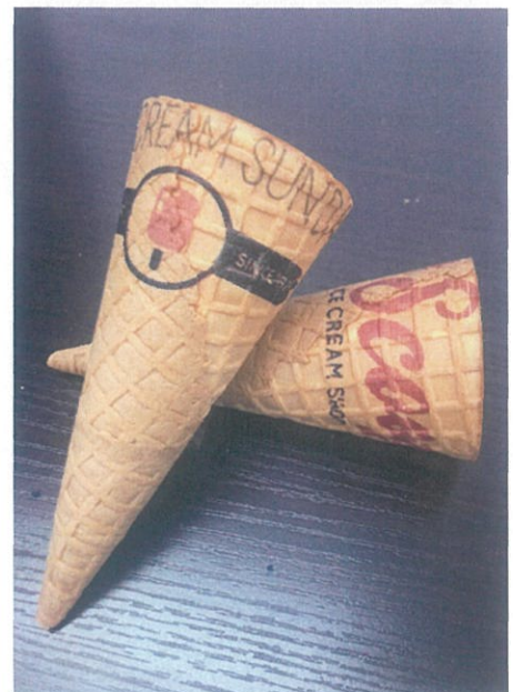
専用インクにより発色が鮮やかできれいな印刷ができる