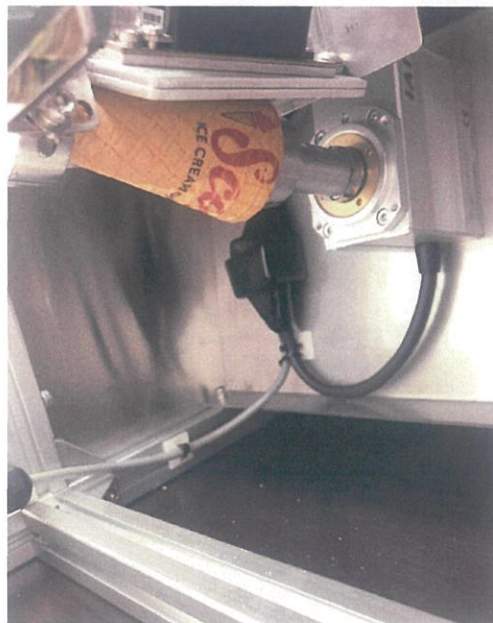
アイスクーンをセットすると自動的に全周に文字やイラストを印刷